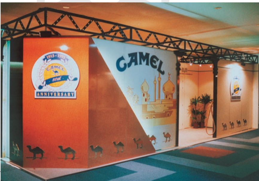
Mathys Expo, CH

To enable the realisation of architecturally demanding solutions, the R8 System is equipped with a wide range of accessories. For example, the R8 frame girder always provides visually exciting solutions to product presentations.