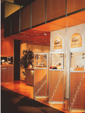
Spektra Werbetechnik, CH