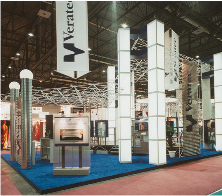
Mathys Expo, CH

Das R8 System aus dem Hause MERO Ausstellungs-Systeme – mehr als nur eines von vielen Aluminiumprofilsystemen.