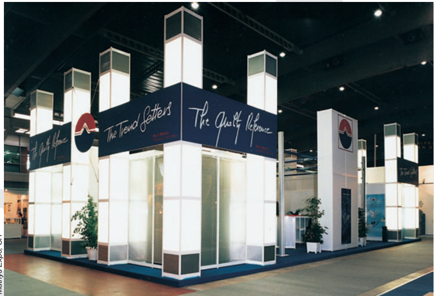
Mathys Expo, CH

When you select the R8 System you choose innovative system technology backed up by the MERO reputation for first class quality and support. MERO has over 50 years of international experience in providing modular construction systems.